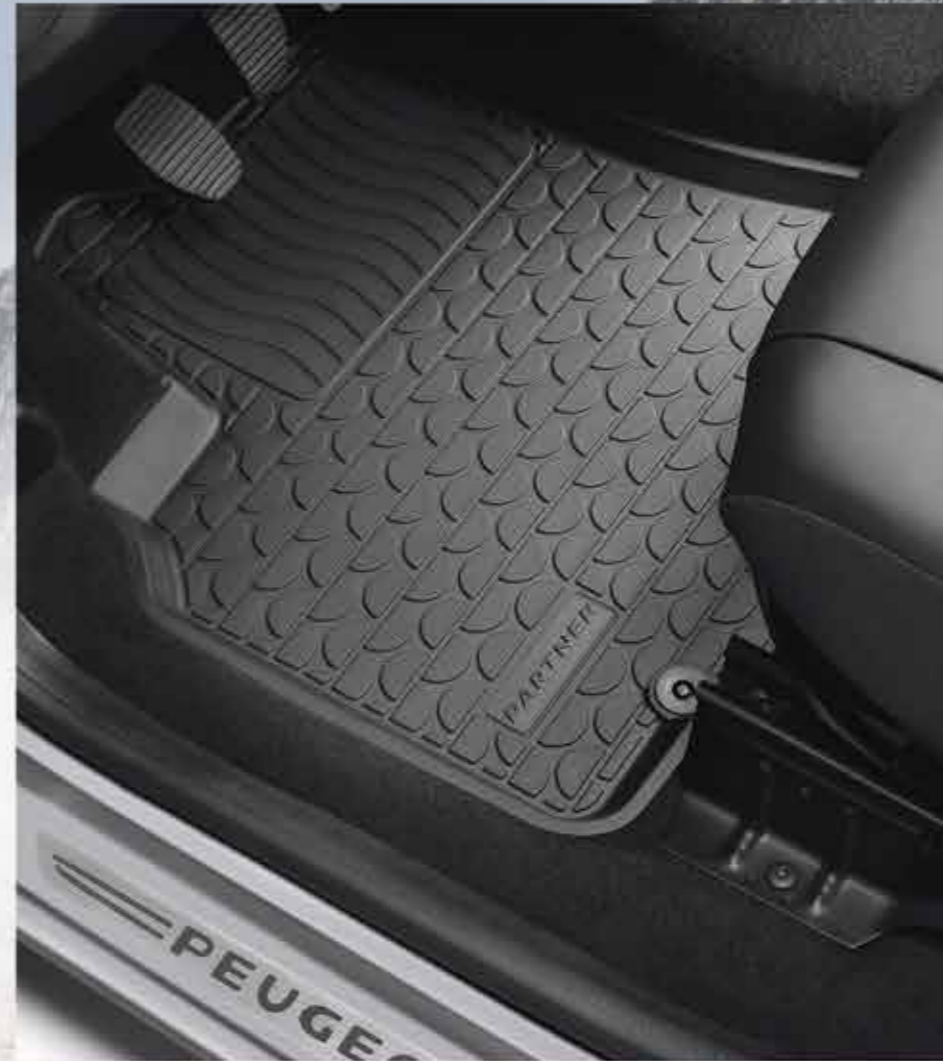
🐾 Набір гумових формованих килимків