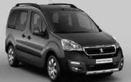
Сіра акула (Gris Shark)