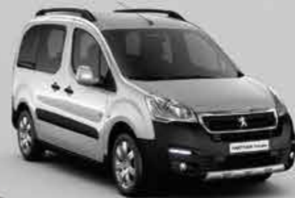
Сірий алюміній (Gris Aluminium)