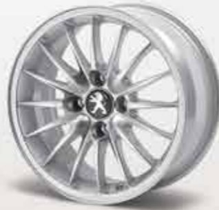
✘ Легкосплавний диск Jet 15"