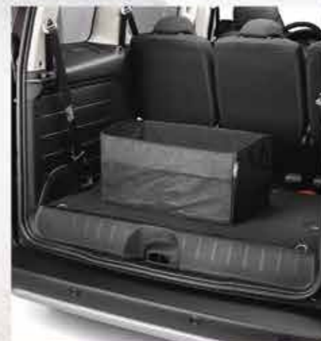
Сумка для багажника