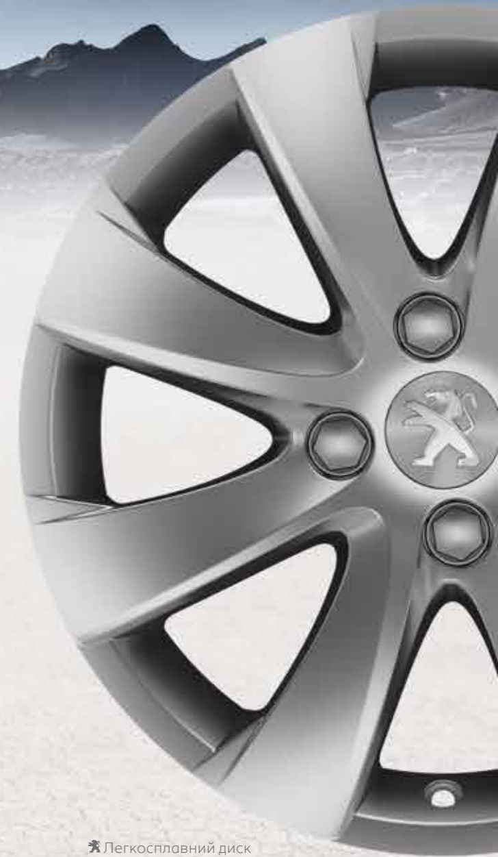
✘ Легкосплавний диск Managua 16"

* Диски продаються без гвинтів та заглушок.