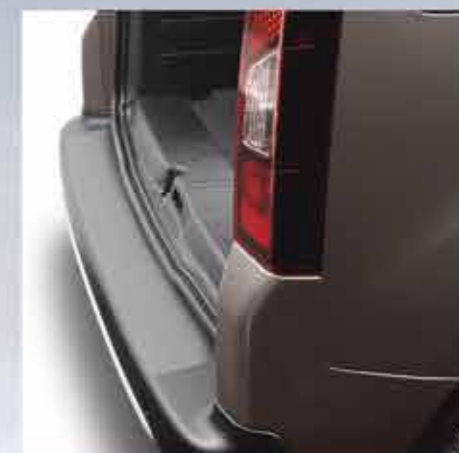
✘ Захисна накладка на поріг багажника