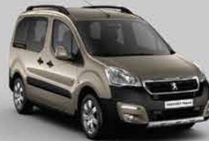
Горіховий (Nocciola) 1