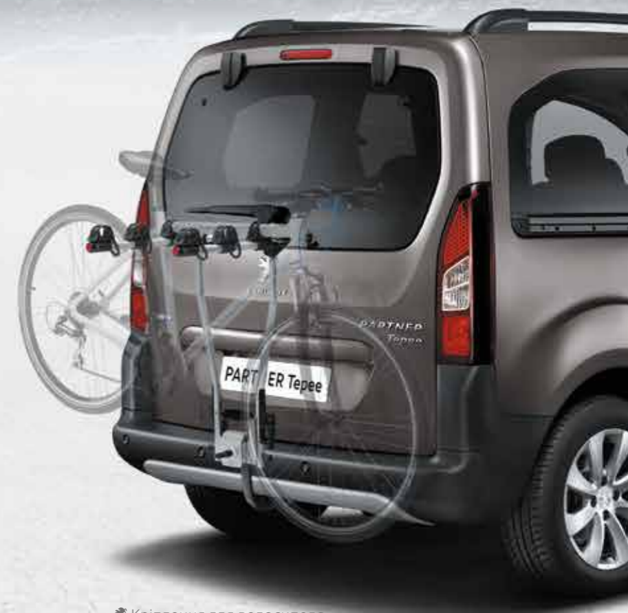
✘ Кріплення для велосипеда на фаркопі