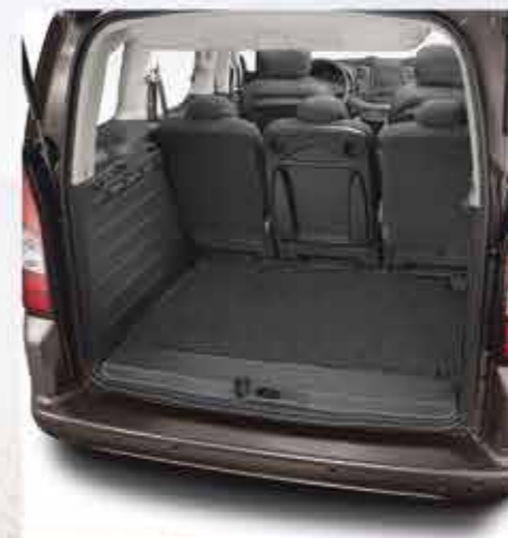
✘ Килимок ворсовий для багажника