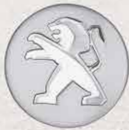
✘ Захисний ковпак «Сірий алюміній»