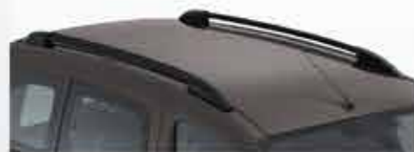
✘ Рейлінги на дах поздовжні

Ваш PEUGEOT Partner Tepee знає, як під час відпочинку та пригод пристосуватися до ваших побажань! Відкрийте для себе аксесуари для перевезення багажу на даху чи на фаркопі для збільшення вантажності вашого автомобіля.