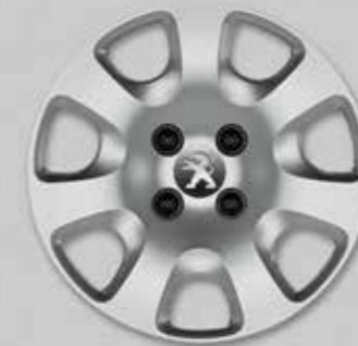
Ковпак Atacama 15 1