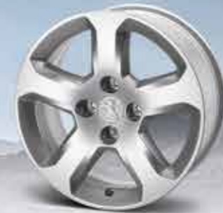
✘ Легкосплавний диск Arenal 16"