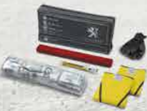
Світловідбивний жилет, знак аварійної зупинки