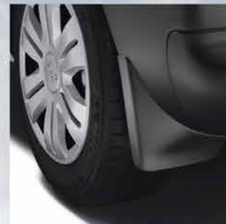
✘ Стильні задні бризковики