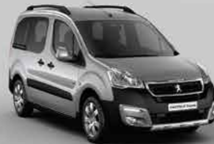
Сірий (Artense) 1