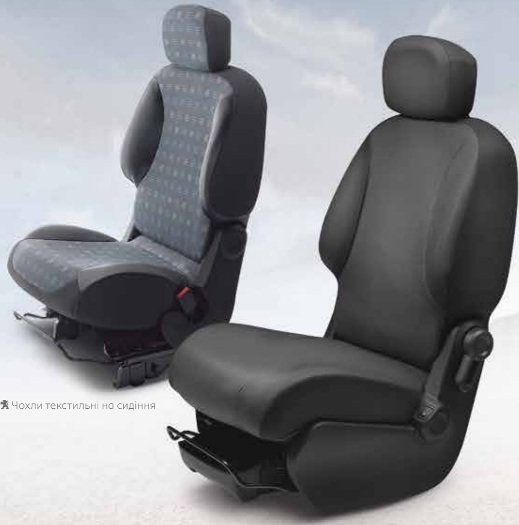
🐾 Чохли текстильні на сидіння

Чохли на сидіння та килимки неодмінно захистять ваш автомобіль. Відкрийте для себе широкий вибір аксесуарів, призначених для вашого Partner Tepee.