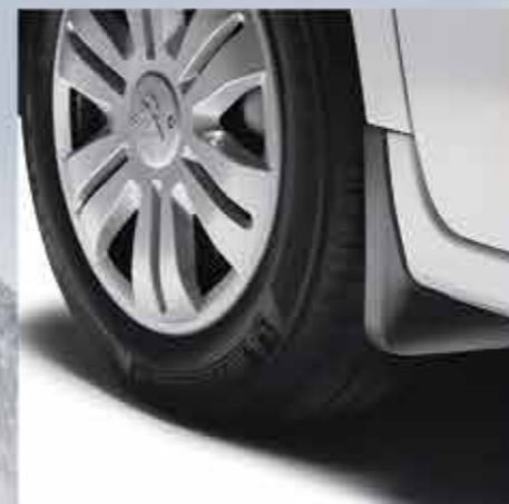
✘ Стильні передні бризковики

Захистіть ваш PEUGEOT Partner Тереє від непередбачуваних випадків завдяки спеціально призначених для цього аксесуарів. Так ви зможете зберегти його естетичний вигляд та подовжити строк його служби.