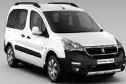
Білий айсберг (Blanc Banquise)