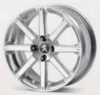
✘ Легкосплавний диск Jordan R 17"