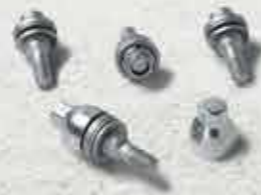
🚗 Секретні колісні болти