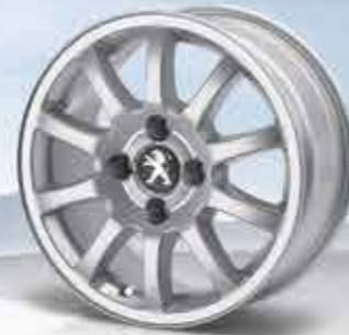
✘ Легкосплавний диск Twenty First 15"