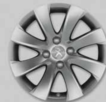
Диск алюмінієвий Managua 16 4