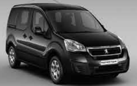
Чорний онікс (Noir Onyx) 2