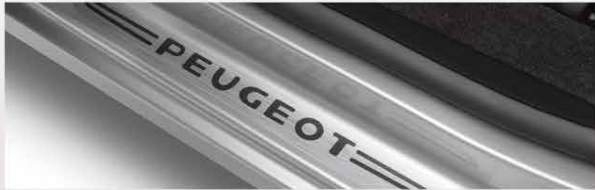
✘ Набір із накладок на пороги передніх дверей під матову нержавку сталь

Збираючись у подорож, потурбуйтеся, щоб ваш новий Partner Терее мав стильний вигляд. Для цього скористайтесь широким асортиментом аксесуарів, спеціально розроблених для того, щоб ваш новий Partner Терее став більш вишуканим. Надайте індивідуальності вигляду вашого PEUGEOT Partner Терее за допомогою легкосплавних дисків* спокусливого дизайну!