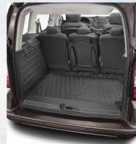
✘ Килимок гумовий для багажника