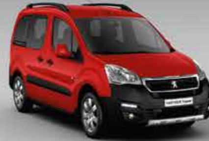
Пекучий червоний (Rouge Ardent)