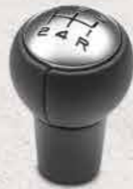
✘ Насадка важеля перемикання передач із чорної шкіри та з хромованою вставкою