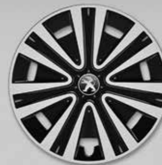
Ковпак Nateo 15 2