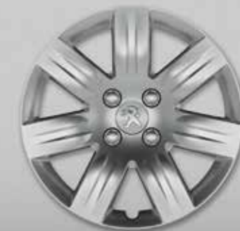
Ковпак Grenade 16 3