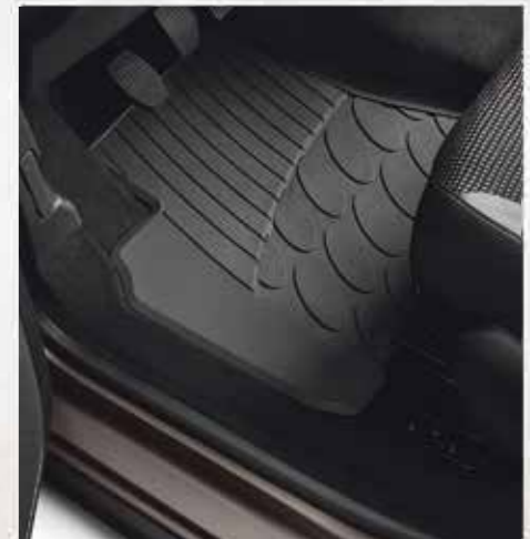
🐾 Набір гумових килимків